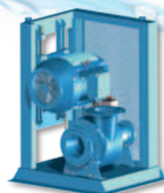
(KM) Met frame, V-snaaraandrijving en elektrische motor