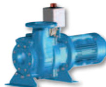
(HS) Kort gekoppeld