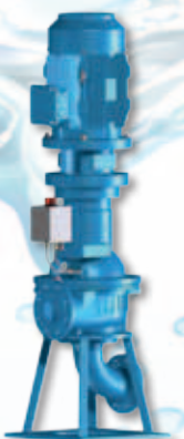
(VM) Met flexibele koppeling en vaste motor, optioneel onderwater opstelling