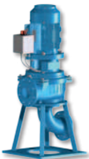
(VS) Kort gekoppeld met optioneel onderwater opstelling