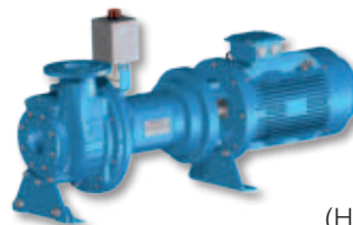
(HF) Met flexibele koppeling, voetstuk en vaste elektrische motor