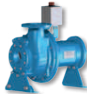
(HX) Vrij aseinde