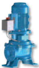
(VS) Kort gekoppeld