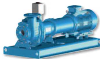
(HM) Met afstandskoppeling, voetstuk en elektrische motor