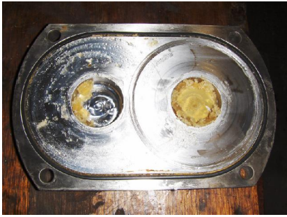
Deksel ingesleten en vervuild