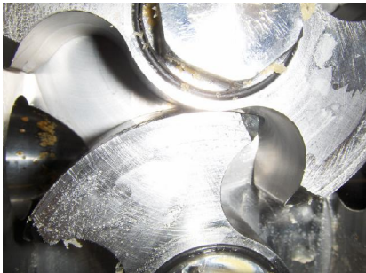
idem aan voorgaande