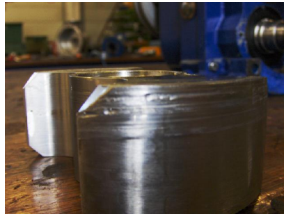
Lobben ernstig ingesleten