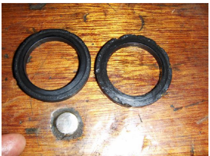
Glijvlakken ernstig beschadigd