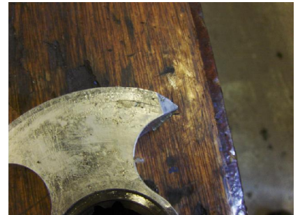
Lobben ernstig ingesleten