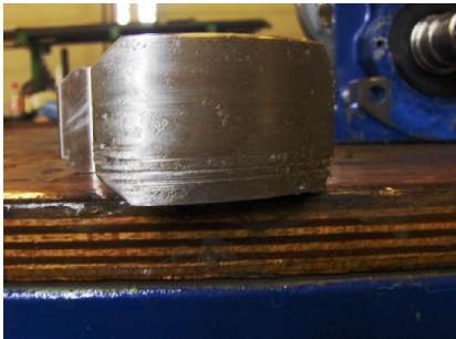
Lobben ernstig ingesleten