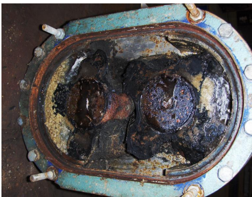
Pomphuis en lobben, ernstig vervuild