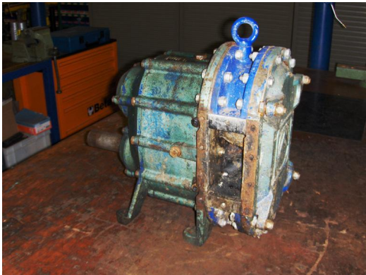
Pomp als ontvangen