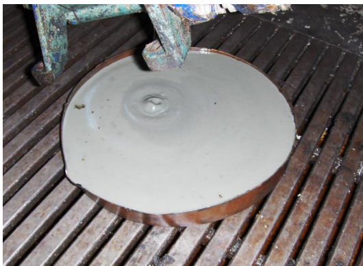
Smeerolie, vervuild met het medium