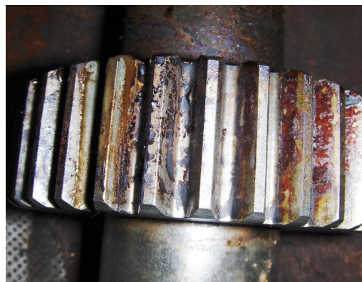
Tandwielen, versleten en aangetast