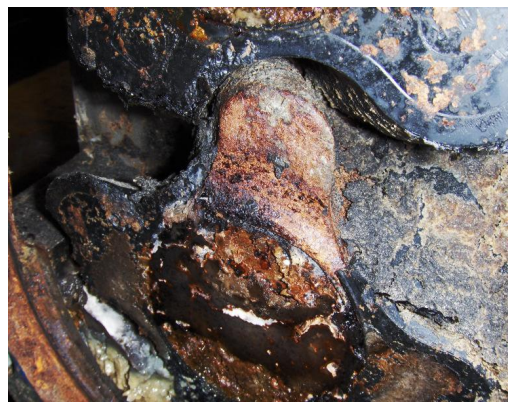
Lobben ernstig vervuild en aangetast