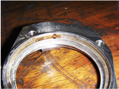
Seal deksel, vervuild