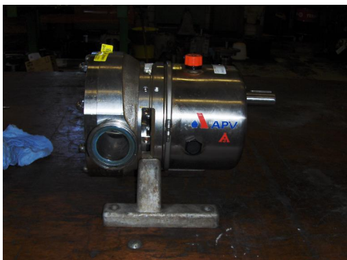
Pomp voor demontage