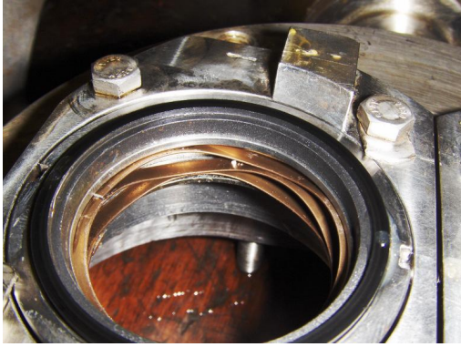
Mechanical seals, ingesleten en vervuild