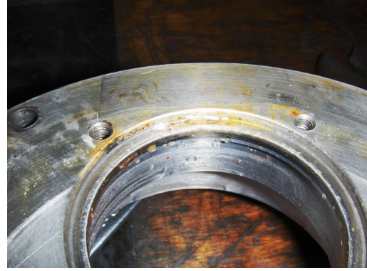
Seal deksel, vervuild