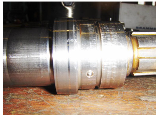
As, t.h.v. keerring loopvlak ingesnoerd