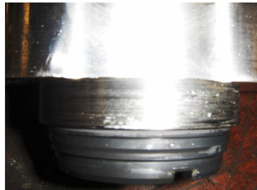
Achterzijde lobben. ingesleten