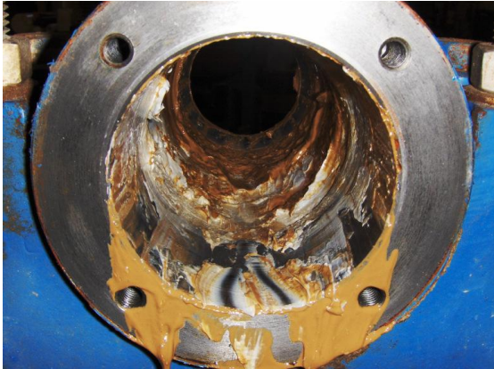
Lagers en huis ernstig vervuild