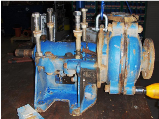
Pomp als ontvangen