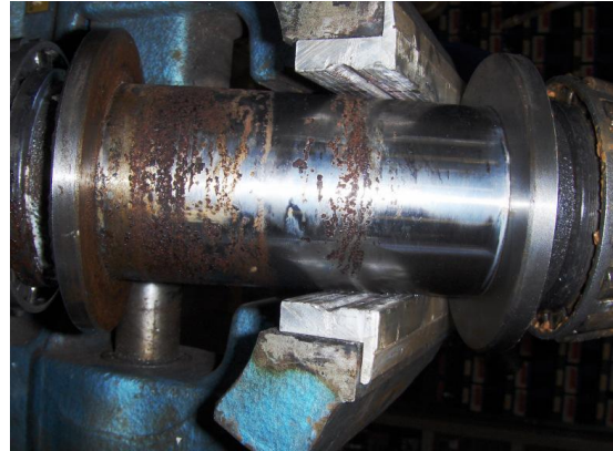
As: t.h.v. de lagers aangetast door corrosie