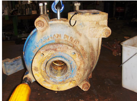
Pomp als ontvangen