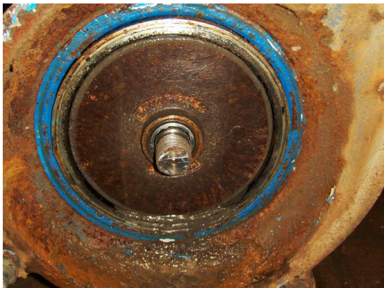
Pompdelen: vervuild en aangetast door oxidatie