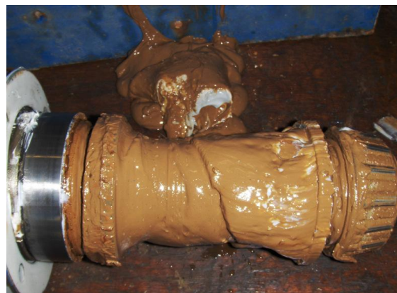
Lagers en huis ernstig vervuild