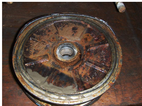
Pompdelen: vervuild en aangetast door oxidatie