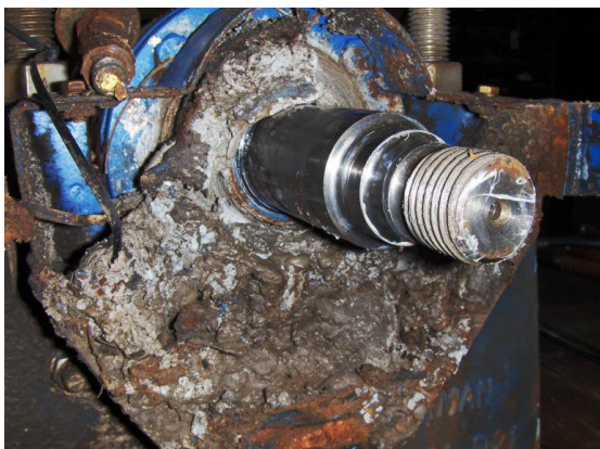
Lagerstoel: uitwendig ernstig vervuild