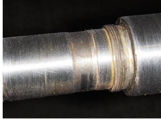
Rotor: op diverse plaatsen ingesleten