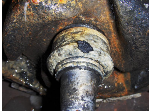
Mechanical seal: vervuild, aangetast en ingesleten