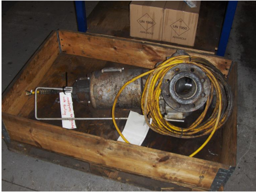
Pomp als ontvangen