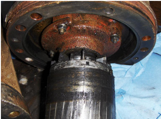
Rotor: op diverse plaatsen ingesleten