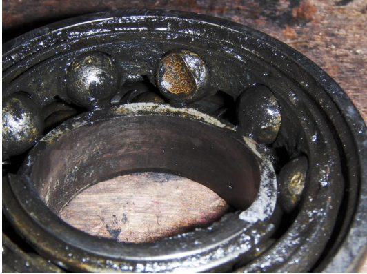
Onderlager: volledig stuk gedraaid