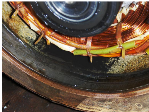
Statorhuis: gevuld met medium