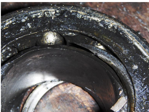
Onderlager: volledig stuk gedraaid