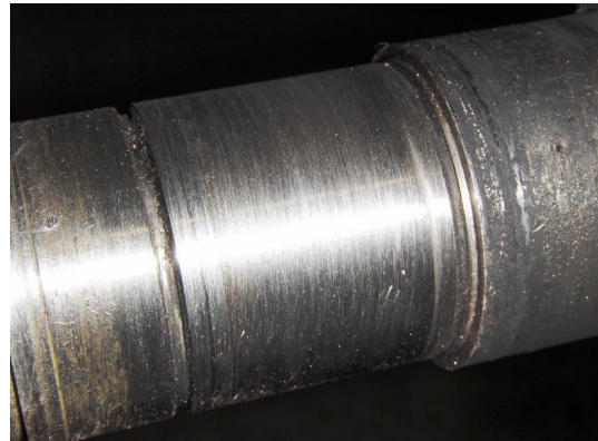
Rotor: op diverse plaatsen ingesleten