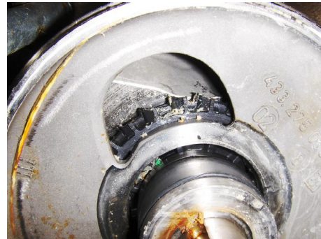
Schoepenwiel, volledig stuk gedraaid.