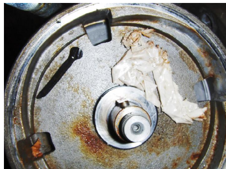
Vervuiling in pomp.