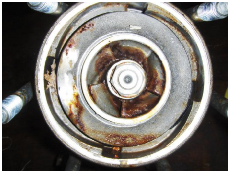
Aanzuig waaier vervuild.