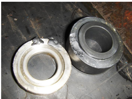
Lager en as bussen, ingesleten en afgebroken.