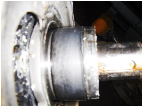
Lager en as bussen, ingesleten.