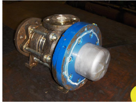
Pomp als ontvangen.