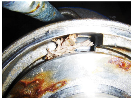
Vervuiling in pomp.