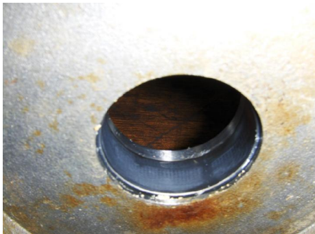
Lager en as bussen, ingesleten.