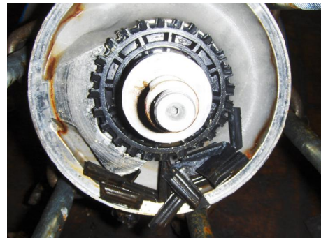
Vane's van schoepenwiel afgebroken.