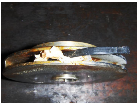
Aanzuigwaaier ernstig vervuild.